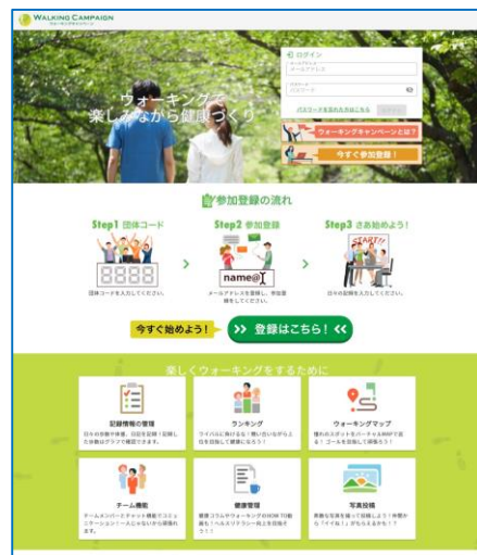
(画面は開発中のものです)